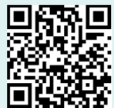
利用者マニュアル (つくば市ホームページ内)