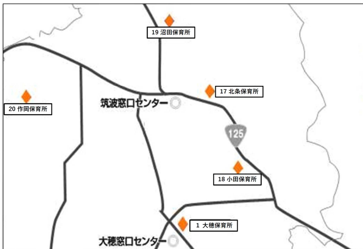
〔小田保育所近辺の保育所等マップ〕