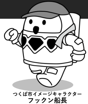
つくば市イメージキャラクター フックン船長

集合 ▶つくば市役所(芝生広場) 〔研究学園1丁目1番地1〕 受付 ▶9:00～9:15 出発 ▶9:30