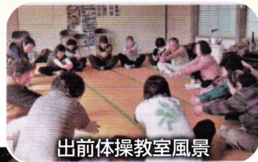
出前体操教室風景