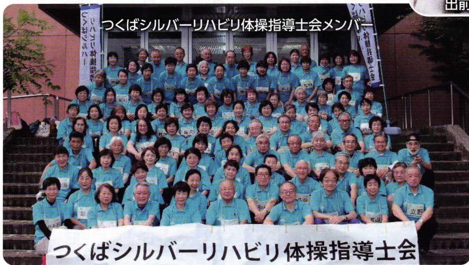
つくばシルバーリハビリ体操指導士会メンバー