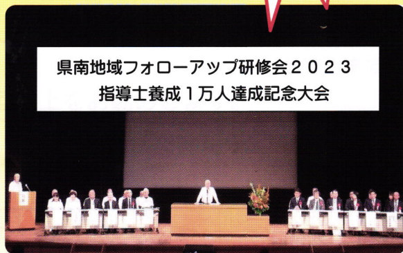
県南地域フォローアップ研修会2023 指導士養成1万人達成記念大会

つくばシルバーリハビリ体操指導士会はつくば市、茨城県と一体となり、高齢者の健康増進、介護予防対策に取り組み、20周年を迎えました。本年は20周年を記念し「健康長寿日本一をつくばから」を目標に「シルバーリハビリ出前体操教室」を1団体5名以上の参加で毎月2回（年間24回）まで無料で皆様の近くの集会所や自治会館等に出前出張して参ります。