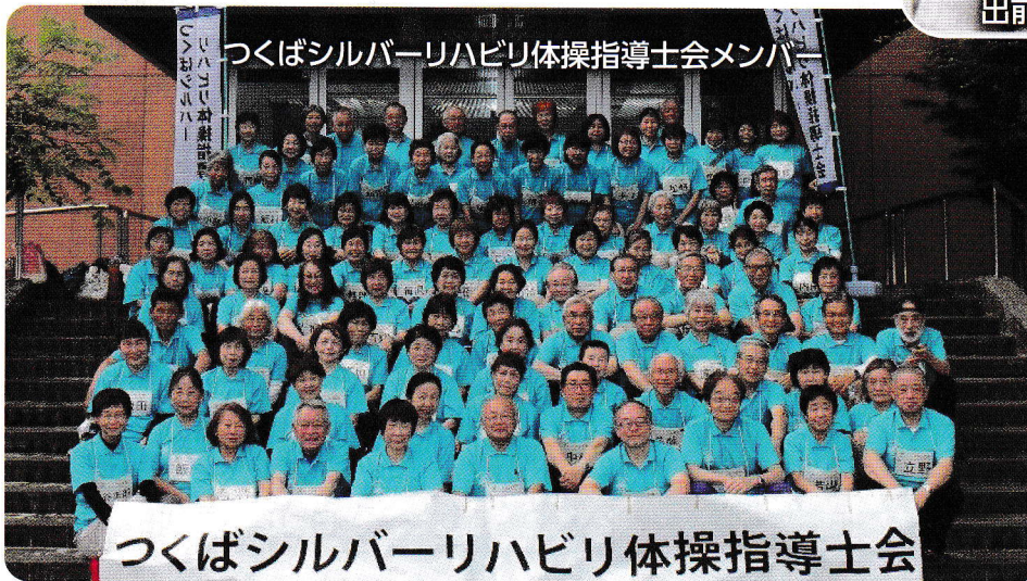
つくばシルバーリハビリ体操指導士会メンバー