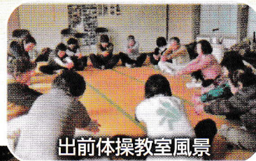
出前体操教室風景