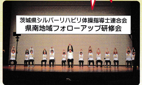
茨城県シルバーリハビリ体操指導士連合会 県南地域フォローアップ研修会

つくばシルバーリハビリ体操指導士会はつくば市、茨城県と一体となり、高齢者の健康増進、介護予防対策に取り組み、22周年を迎えました。「健康長寿日本一をつくばから」を目標に「シルバーリハビリ出前体操教室」を1団体5名以上の参加で毎月2回(年間24回)まで無料で皆様の近くの集会所や自治会館等に出張して参ります。