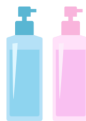
シャンプー・ トリートメント