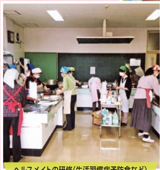
ヘルスメイトの研修(生活習慣病予防食など)