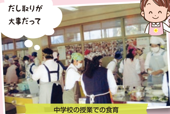
中学校の授業での食育