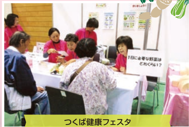
つくば健康フェスタ