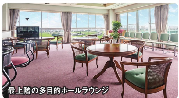
最上階の多目的ホールラウンジ