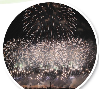
土浦全国花火競技大会

土浦市街を一望に見渡せる高台に位置し、 天気の良い日は各部屋から富士山が望めます。 毎年秋の「土浦全国花火競技大会」は、 ご家族とともにホームからの観賞をお楽しみいただけます。