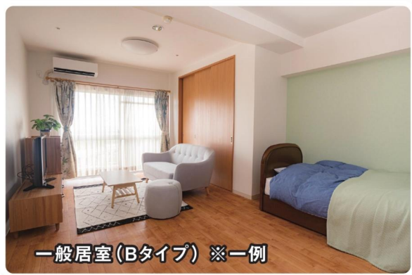
一般居室(Bタイプ) ※一例