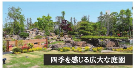
四季を感じる広大な庭園