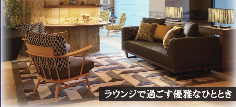
ラウンジで過ごす優雅なひととき