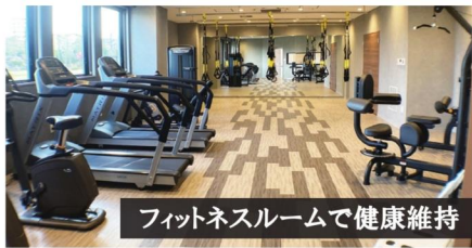
フィットネスルームで健康維持