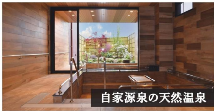
自家源泉の天然温泉