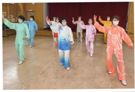
並木太極拳同好会の皆さん