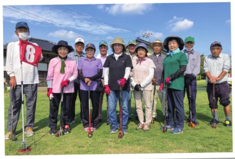
筑波愛好会と吉沼グラウンド ゴルフ愛好会の皆さん

「つくバネ!2022年度版」の制作にあたり ご協力いただきました各団体の皆様 ありがとうございました。