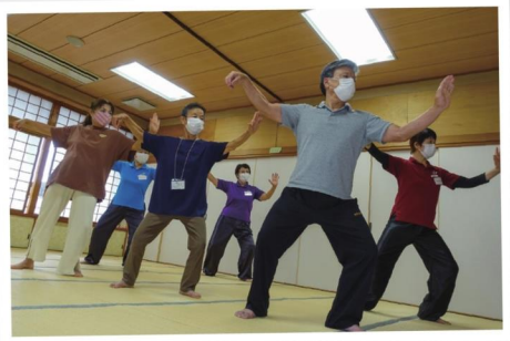
いきいきサロン 「ゆったりのにのび太極拳」に 参加の皆さん