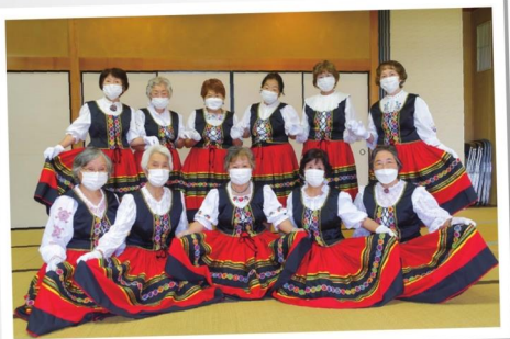
荃崎FDCカトレア会の皆さん