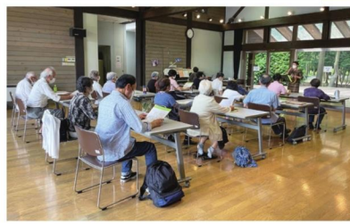
たまきと真知子の みんなで歌おう