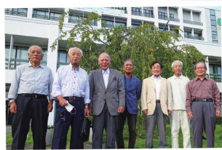
つくば市シルバークラブ連合会 役員の皆さん