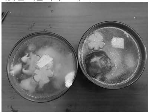
↑ 일본인 친구와 함께 만든 오조니

오조니는 지역별로 재료의 차이가 큰 것으로도 유명한데, 예를 들면 츠크바가 속해있는 칸토 지방에서는 직사각형의 떡을, 간사이지방에서는 동그란 떡을 사용하는 등 차이점이 있습니다. 또 안에 팥이 들어 있는 떡을 사용하기도 하는 등 지역마다 또 각 가정마다 특색 있는 오조니가 된다는 점이 흥미롭지 않으신가요? 올해 겨울에는 일본의 떡국, 오조니를 만들어 드셔보시는 것은 어떨까요?