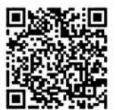
Peta rawan bencana hanya dalam Bahasa Jepang

➤ Untuk melindungi diri sendiri dari banjir atau tanah longsor dan lain-lain, mari periksa peta rawan bencana apakah rumah, sekolah, tempat kerja Anda berada di lokasi yang berbahaya. Peta rawan bencana adalah peta yang menunjukkan area/daerah yang kemungkinan terjadi banjir, tanah longsor dan lain-lain.