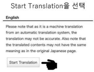
Start Translation을 선택