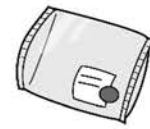
ถุงขนมปัง