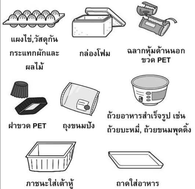
แผงไข่, วัสดุกันกระแทกผักและผลไม้