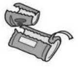
ฉลากหุ้มด้านนอกขวด PET