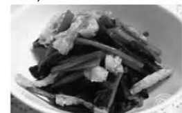
โฮเรนโซ โทะ อะบุระอะเกะ โนะ โอฮิทะชิ (Horenso to Aburaake no Ohitashi)