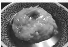
เรนคอน โนะ ชินโจว (Renkon no Shinjyou)

ติดต่อสอบถาม: แผนกศิลปวัฒนธรรม (Bunka-Geijutsu-Ka)