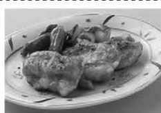
โทริ โนะ คูวะยะคิ (Tori no Kuwayaki)