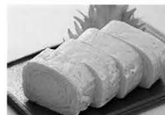
ดะชิมะคิ ทะมะโกะ (Dashimaki Tamago)