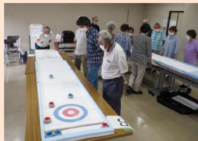
▲カーレット講習会