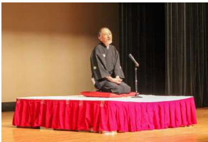
▲楽しい時間を過ごしました（落語の一席）

生きがいと健康づくりを目的に様々な取り組みをしているシルバークラブですが、12月に「生き生きシルバー教室」を開催しました。