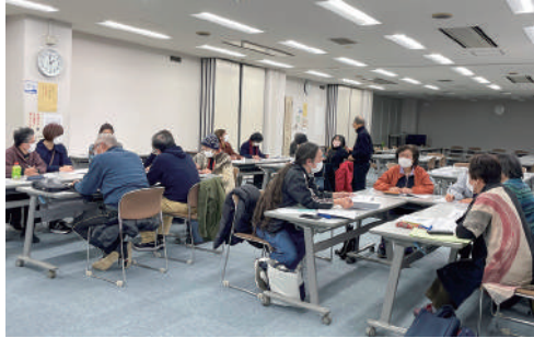
▲吾妻・竹園東・竹園西・並木・桜南小学校区