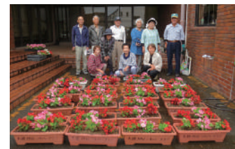
▲春には「花いっぱい運動」を実施し大穂地区の各施設にプランターを設置しています!

この他にも、コロナ禍により近年は中止となっていますが、毎年秋には「わくわくまつり」として地区運動会を開催し、玉入れやパン食い競争、宝探し等を楽しんでいます。また、市外への「研修会」や各種講習会を開催する「シルバー教室」、地域の見守り活動を行う「友愛訪問活動」、地域や区会と連携した「奉仕活動」など多岐にわたる活動を行っています。