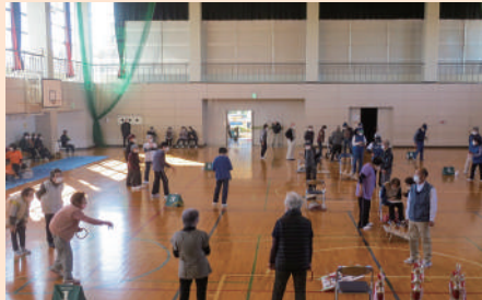
▲輪投げ大会の様子・・・ 100名以上の参加者が、密を避けながら楽しんでいました