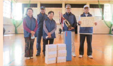
▲輪投げ大会の優勝は「花畑シルバークラブ」の皆さん・・・ おめでとうございます!