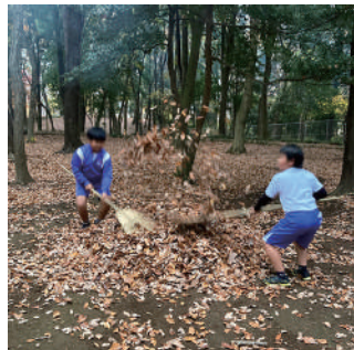
▲何でも遊び道具に変えてしまう 天才です！