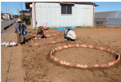
▲花壇づくりをしています

上郷大山地区で活動している「ほのぼのクラブ」におじゃまさせていただきました。 昨年4月に発足したばかりですが、この活動の狙いとする大切なところは、地域内での支えあい活動を目指していることです。徐々にではありますが、地域住民同士で助けあいの輪が広がっているようです。