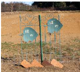
▲ほのぼのクラブの花壇が完成

この日は、環境美化活動の一環で花壇づくりをしていました。私もお手伝いをさせていただきましたが、皆さん和気あいあいとした雰囲気の中、作業をしていました。後日、球根の植え付け作業をしたので、春になったら、きれいな花が咲き誇っていると思います。お近くにお立ち寄りの際は、ぜひご鑑賞ください。