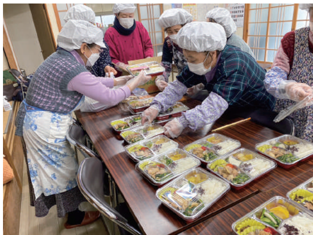
▲地域の皆さんが心を込めて作ったお弁当です

生活支援コーディネーターとして参加させていただき、ボランティアの皆さんから「地域に対する思いや熱意」を感じました。地域でみんなが支えあい楽しく活動ができること、お弁当をきっかけに一人ひとりがつながっていくことで安心して暮らせる地域づくりが進められるように、地域住民の力を合わせ今後もこの事業を進めていきたいと思えます。皆さんの笑顔や楽しいお話に、たくさんの力を頂いた一日となりました。