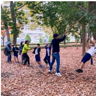
▲みんなでロープ遊び！ 大人も参加で大盛り上がり！