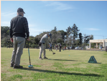
▲グラウンドゴルフ大会の様子・・・ 目指せ! ホールインワン

日々の活動はそれぞれの地区によって異なりますが、大穂地区では年に数回、すべてのシルバークラブが集まり、ニュースポーツ大会としてグラウンドゴルフ大会や輪投げ大会を行っています。