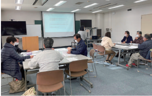
▲九重・栄・栗原小学校区