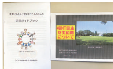
▲今回の資料「防災ガイドブック」と「桜ニュータウン自主防災組織について」