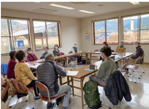
▲会議のメンバーからは様々な質問が出されました

月2回開催している「桜池 おひげ サロン」です。代表メンバーから質問し、サロンの主催者と参加者のお話をそれぞれ伺うことができました。長年、桜池サロンに通っている参加者は、「楽しみを見つけることが長生きの秘訣。ここは顔見知りの仲間がいるので楽しい」とおっしゃっていました。