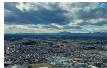
▲茨城県庁の展望台から見た筑波山

いつも桜圏域の皆さまから優しく声をかけていただき、おしゃべりして笑わせてもらっていることが私の励みになっています。いつもありがとうございます!