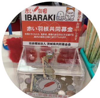
▲売店には募金箱を設置

ご協力いただいた皆様、どうもありがとうございました。今後も活動を続けていきますので、どうぞよろしくお祈りします。