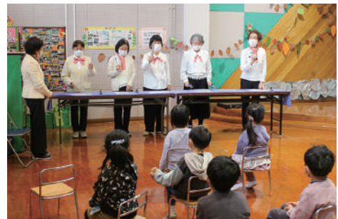
▲久しぶりに練習の成果を見せることができました