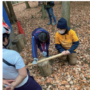
▲ちょっと危ない道具を使う時も、 大人がしっかり見守ります