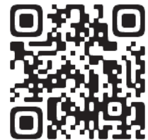
▲つくばdeプレイパーク ひろめ隊Instagram