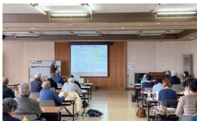
▲参加者からは「参考になった」という感想が多く聞かれました