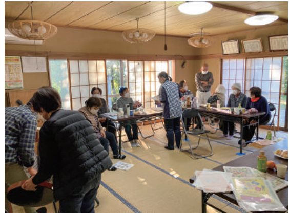
▲説明が終わった後も講師への質問が絶えません

参加者からは、「いつまでも元気で居続けたいけれど、もしもの時はお世話になるので、今日は来てよかった」といった声を伺うことができました。