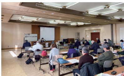
▲皆さん真剣に説明を聞いていました

また、荃崎ボランティア連絡会では、ふれあい交流会の開催企画や情報交換等を行っています。興味のある方は、ぜひ社協までお問い合わせください。