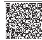
申込サイトQRコード

※上記の内容は変更する場合があります。その際には大会HPでお知らせしますので、適宜HPをご確認ください。