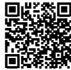
ツクバサイクル特設ページ

目的によって2種類に分けることができます。一つ目は、より多くの市民の皆さんに自転車を使っていただくための取り組み(自転車利用の推進)、二つ目は、市民の皆さんに「安全に」自転車を使ってもらうための取り組みです(自転車安全利用の推進)。