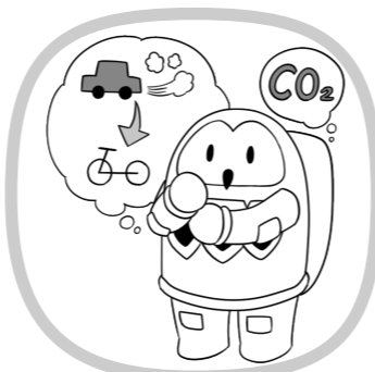
ゼロカーボン シティの実現