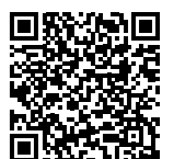
自転車保険の詳細はこちら▲