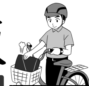
つくば市長 五十嵐立青