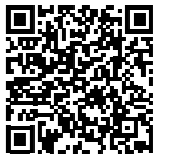
茨城県警察ホームページ「自転車の安全利用について」

自転車は道路交通法上の「軽車両」に該当し、さまざまなルールを守らなければならない乗り物です(例えば、4月からヘルメットの着用が全国で努力義務となりました)。でも、ルールがしっかり守られていない場合があり、全国的に自転車関連事故が増えています(2021年69,694件→2022年69,985件)。ここでは、自転車を使う人にはもちろん、周りの歩行者や車などにもやさしいまちにしておくための「自転車安全利用の推進」の取り組みを紹介します!