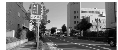
自転車専用通行帯▲