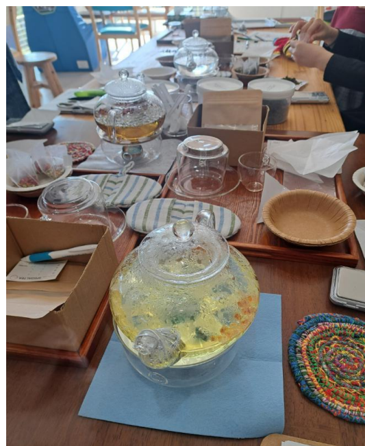
休館日を利用した ワークショップ