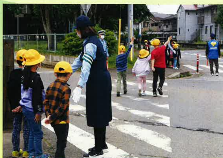
新入生交通安全教室