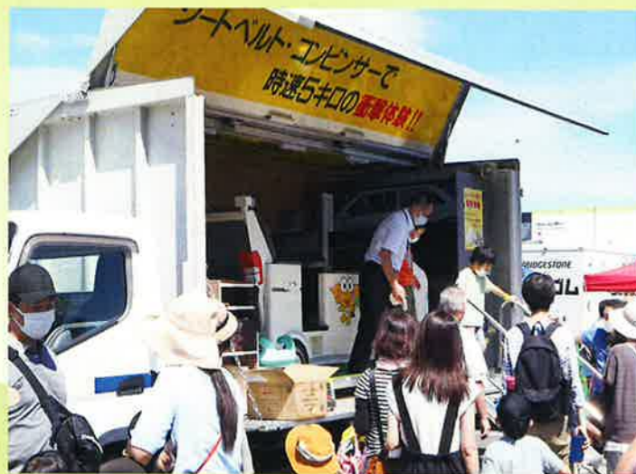
イベントでシートベルト衝撃体験車出動

交通安全協会は「交通事故ゼロ」を目指して 家庭・学校・地域社会に密着した活動を続けています