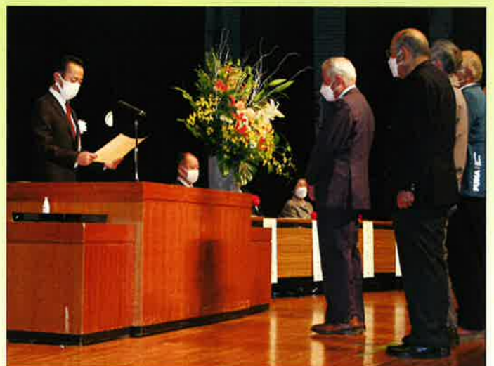
交通安全功労者・優良運転者表彰式