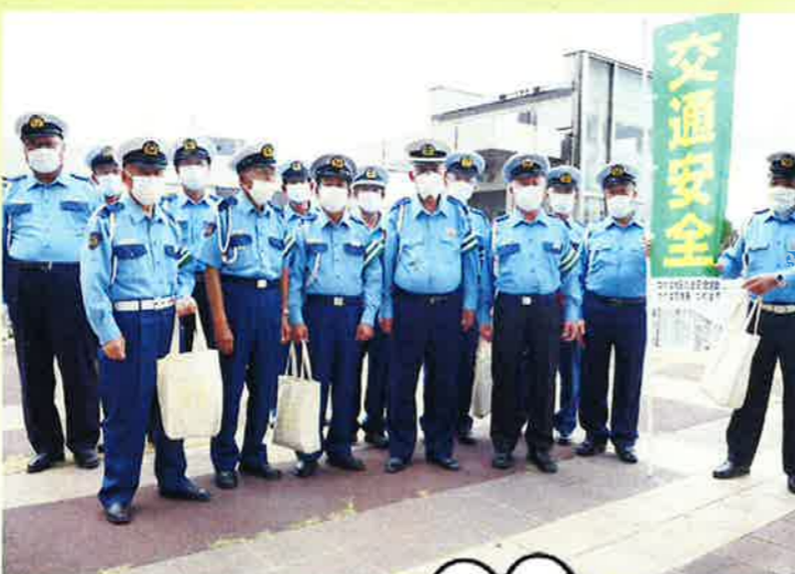
全国交通安全 キャンペーン