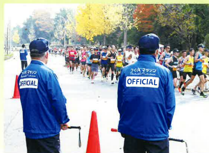
つくばマラソン警備