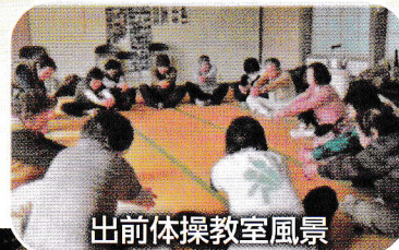
出前体操教室風景