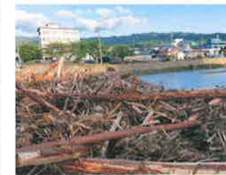
令和6年能登半島大雨災害(輪島市)