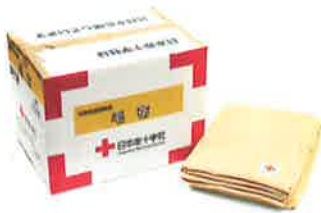
被災者配布用毛布 1人分