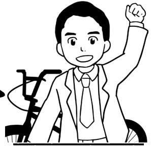
つくば市長 五十嵐立青