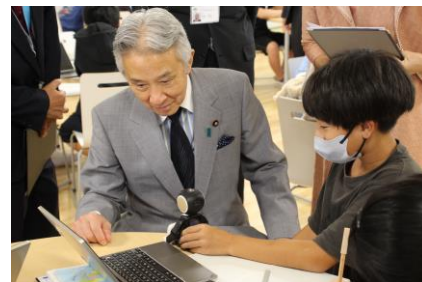
【AI 活用・文部科学大臣とともに】

*イェナプラン教育は、ドイツで始まりオランダで広がった、一人ひとりを尊重しながら自律と共生を学ぶオープンモデルの教育です。