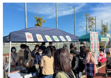
【みどサポ・制服お譲り会】

保護者のみなさまとの連携を大切に考えるみどりの南小・中学校は、保護者支援組織の形成に関して、開校準備委員会で真摯に協議を進めています。みどりの学園で実践されている「サポーター形式」を採用するか、伝統的な PTA 組織を設立するか、どちらが保護者のみなさまや子どもたちにとって最も適しているかを慎重に検討中です。私たちが目指すのは、保護者のみなさまが安心して参加し、子どもたちの成長を共にサポートできる組織づくりです。