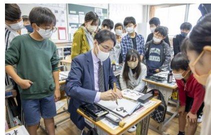
【美文字王子の書写授業】

みどりの南小・中学校では、外部リソース（現在、シャープ等の IT 関連企業、エンボス企画、カスミ、スマートチェックアウト、大学等）を最大限に活用した教育活動や各種学校行事、年間スケジュールに関しても、みどりの学園の実績あるカリキュラムを基盤としており、大きな変更は予定していません。安定した教育環境の中で、子どもたちの成長をしっかりとサポートいたします。