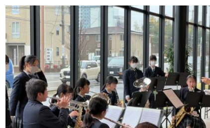
【みどりの地域での演奏会】

放課後の sports & culture 活動、すなわち部活動については、みどりの学園で展開されている豊富なプログラムを継続して提供しよう協議を進めています。つくば市や民間企業との連携を深めることで、安定した活動環境を確保してまいります。子どもたちの才能や興味を最大限に伸ばすためのサポートを、民間企業とともにしっかりと進めます。