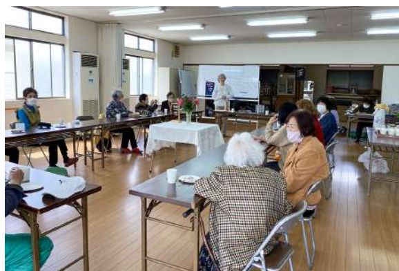
▲皆さんの穏やかな笑顔が印象的でした

メンバーの方々は、それぞれの個性を活かし、協力し合って楽しい時間をつくり上げています。4月の開催時には茶話会が催され、自治会館内は終始和やかな雰囲気にもまれていました。テーブルの真ん中に飾ってある花瓶には、お花を育てることが得意な方が持ってきてくださったきれいな花が! とても温かい気持ちになりました。