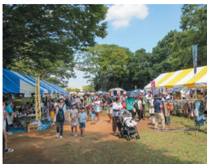
▲広場内には20以上の団体がブースを設置