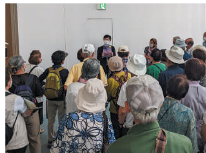
▲美術館で学芸員の説明を真剣に聞いています

身体を動かすきっかけとしても、仲間を作る場としても最適な場の一つが桜地区シルバークラブ連合会です。会員は随時募集しています。興味がある方は、下記コーディネーターまでお気軽にご連絡ください。