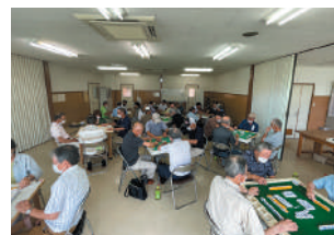
▲麻雀は卓を移動して3回戦を実施

サロン活動やシルバークラブ事業について興味がある方は、下記コーディネーターまでお気軽にご連絡ください。