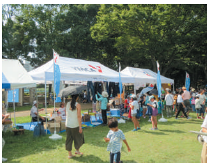
▲様々な物品販売も行います