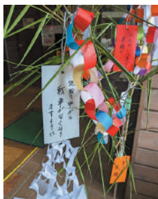
▲短冊の願いは世界平和!

一人目の方はもうすぐ90歳になる方で、小学校4年生くらいの頃につくば市内で戦争を経験したそうです。「登校の途中で空襲警報が鳴って防空壕へ逃げたり、学校に着いても兵隊さんが教室にいて勉強どころではなかった」との話を伺いました。二人目の方は東京出身で、食べ物に大変苦労されたとのことでした。着物をお米に代えた話やジャガイモなどのでんぷん料理の話を披露すると、他の参加者からも「学校にお弁当を持って行くことができなくて、昼休みに外で過ごしていた子もいたねえ」と……。現在のように物にあふれた豊かな時代を考えると、想像もつかないお話でした。当時の暮らしを聞くことができ、改めて平和の大切さを実感しました。