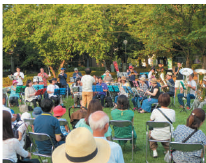
▲17時からはミニコンサートを実施

今年はずいぶん、「まつりつくば」が開催されることとなりました。実に、4年ぶりの開催となります。この「まつりつくば」は、パレードやステージ、アートタウンなど複数の部門で構成されていますが、その一つとなる「ふれあい広場」を担当しているのが、つくば市社会福祉協議会となります。