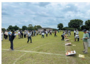
▲輪投げは9つの輪を投げて合計点を競います

健康麻雀大会は約4年ぶりの開催となりましたが、36名の参加があり、「お酒を飲まない」「煙草を吸わない」「お金を賭けない」という趣旨のもと、多くの方との交流を図りながら、対局が行われていました。