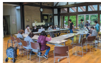
▲普段のサロンの様子です