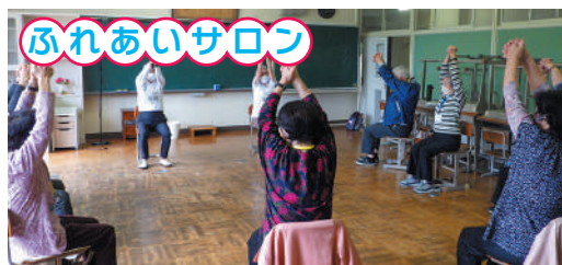
▲季節の行事や体操、みんなのおしゃべりが元気の源です!

それぞれの活動に参加したい、詳しく情報が知りたい等がありましたら、下記コーディネーターまでお気軽にお問い合わせください。