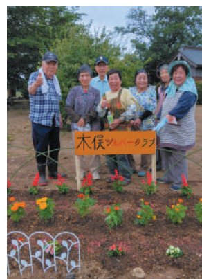
▲せっかくだから記念写真!(^^)!