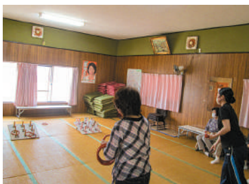
▲輪投げ体験! 意外と難しい・・・

「新地下花の会」は、毎月第3水曜日に吉沼の新地下町公民館で活動しています。活動内容は、シニア向けの講話や輪投げ大会、健康体操教室(年4回)、お楽しみ食事会、カラオケ、昔遊び、ゲーム、季節イベント等を行っています。現在は、ボランティアを含めて18名の会員がおり、60代から90代まで幅広く、おしゃべりや体操、食事会等の楽しい時間を過ごしています。