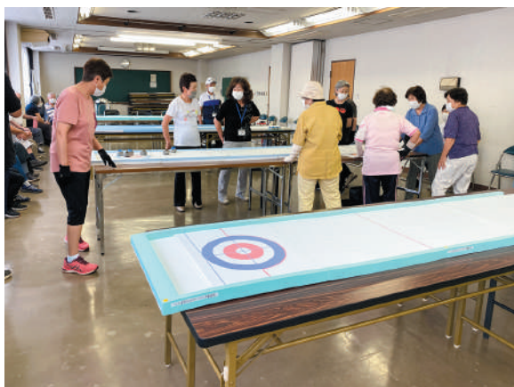
▲狙い通りのショットができた時の気分は格別です!

シルバークラブの活動に参加したい、詳しい情報が知りたい等がありましたら、下記コーディネーターまでお気軽にお問合せください。