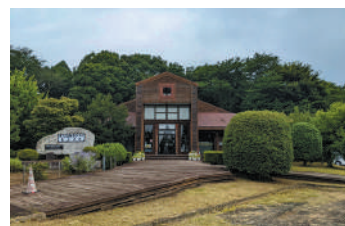
▲会場の老人福祉センターとよさと