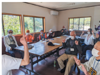
▲移転後初めてのサロン活動（健康体操）

日時：毎月第2火曜日 10:00～11:30 場所：ミニストップつくば春風台店そば ※詳細は下記コーディネーターへ