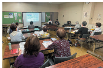
▲皆さん真剣に話を聞いています

この他にも、くきざき広場では茶話会や手芸、調理実習、食事会、季節のイベントなども行っています。様々な催しを通して交流が図られ、皆さん毎月の活動を楽しみにしているようでした。