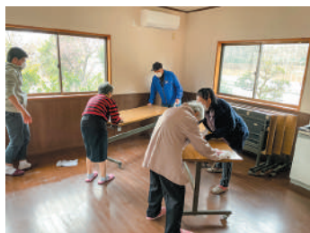
▲みんなで空き家の掃除を行いました

春風台には集会場がないため、近くのレストランを借りてサロン活動を行ってききましたが、サロンに参加している方の所有している空き家を本拠地として使わせていただける運びとなりました。皆さんで力を合わせ空き家の掃除をして、令和5年4月の活動から新たな場所でサロン活動をしています。市内でも空き家が増えていますので、ぜひ有効活用の例として参考にしてみてください。