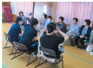
▲サロンの方々インタビュー! 色々な話が聞けました

先日、サロンを訪問した際には、土浦看護専門学校の実習生を受け入れ、一緒に輪投げやおしゃべりをしてサロン活動を楽しみ、実習生もサロンを通して地域活動を学んでいました。