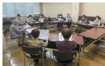
▲健康長寿の標語をみんなで読みました