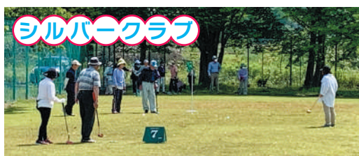
▲グラウンドゴルフや輪投げなど様々なスポーツが盛んです!