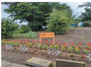
▲きれいな花壇に仕上がりました!

雨が上がり、会長さんと一緒に見た花壇は心がとても温かくなる感じがしました。近くを通った際には、ぜひ目を留めてお楽しみください。