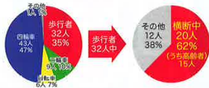
茨城県内の交通死亡事故の特徴(令和4年)

令和4年中、茨城県内での歩行者の交通事故死者数は32人(前年比1人減)で、全死者数の35.2%を占めています。また、道路横断中の歩行者の死者は20人(前年比±0人)であり、さらに高齢者にあつてはそのうち15人(前年比4人減)で、依然として高い割合を占めています。交差点では信号を守るとともに、横断歩道でも十分な注意が必要です。