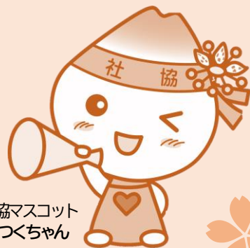
つくば市社協マスコット つくちゃん

社協活動の趣旨にご理解いただき、社協及び地域福祉活動を財政面で支えてくださる応援団です！