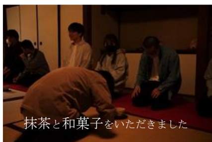
抹茶と和菓子をいただきました