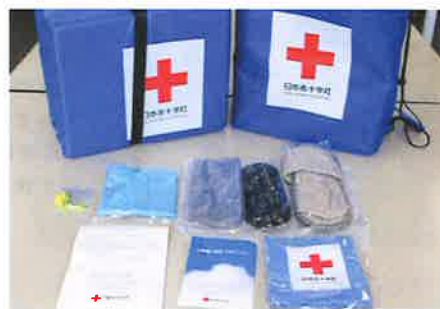
▲避難所生活に必要な救援物資(マット等)