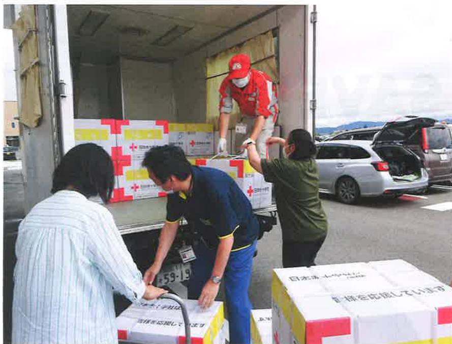
▲【令和4年8月大雨災害】救援物資を被災地に届ける日赤職員