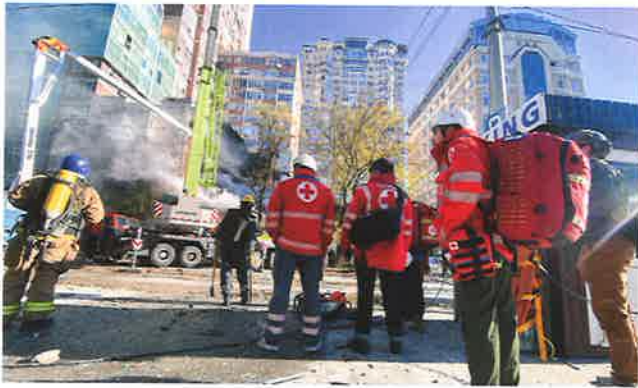
▲首都キーウで攻撃のなか、24時間体制で対応する緊急対応チーム

日本赤十字社は、資金援助に加え、ウクライナや周辺国に職員を派遣し、現地のニーズに対応した支援活動を展開しています。