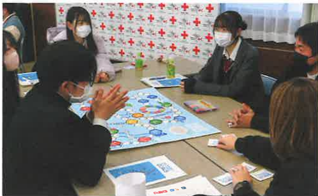
▲SDGsについて学ぶ高校生メンバー

本県では、350校、約66,000人のメンバーが、校内外での清掃活動、慰問、募金活動等の活動を通して、赤十字の心を育てています。