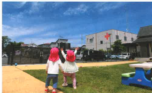
▲しゃぼん玉を追いかける乳幼児

また、乳児院では、子どもたちと一緒に遊び、授乳や離乳食を介助するボランティアが活躍しています。