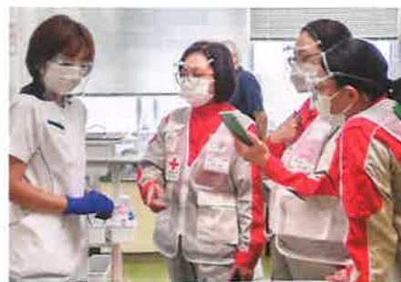
▲医療支援を行う日赤職員