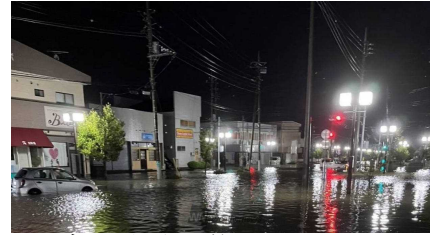
令和5年台風第13号による県内の浸水被害の様子