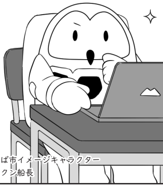
つくば市イメージキャラクター フックン船長