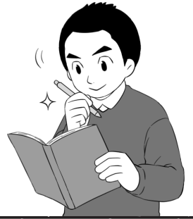
つくば市長 五十嵐立青