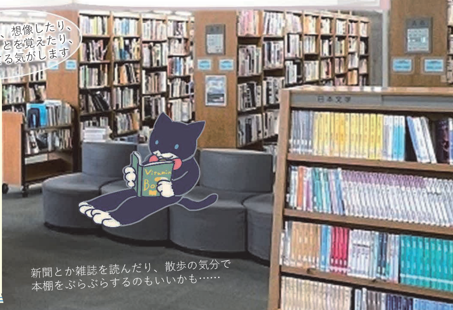
新聞とか雑誌を読んだり、散歩の気分でお本棚をぶらぶらするのもいいかも……

「読書が好き」という方も、「最近あまり本は読まないな」という方も、健康と読書という言葉がなかなか結び付かないと思う方は多いかもしれません。家の中で本を読んでいるだけで健康というのは、ちょっと難しいのかな? そんなうまい話ないかも……。 でも本当にそうでしょうか? 誰かと話すようにエッセイを読む。旅をしたつもりで旅行の本を読む。野草の本を読んだら、思わず外へ探しに出る。 さまざまな本には「世界」が詰まっています。今ここにはないその刺激こそ、本が持つ私たちへのすばらしい効果目なのではないでしょうか? あなたが読みたいと思った本。どんな本も大正解。 読書で健康になってみませんか? ヨモツカ編集長