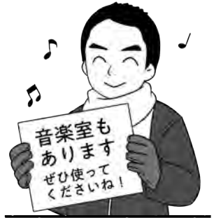
つくば市長 五十嵐立青