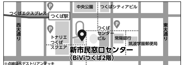
つくば駅前市民窓口センター