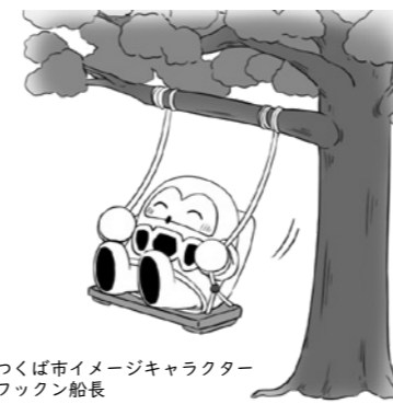
つくば市イメージキャラクター フックン船長