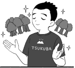
つくば市長 五十嵐立青