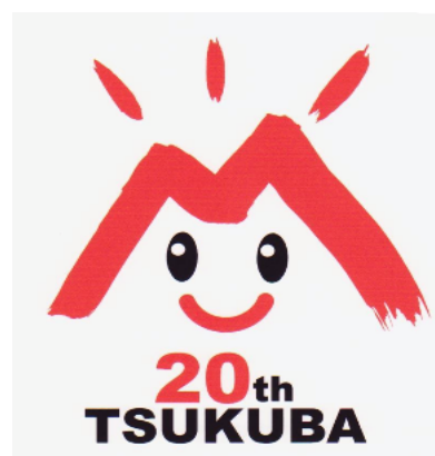
作者:廿日市市 堀江 豊さん