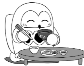
つくば市イメージキャラクター フックン船長