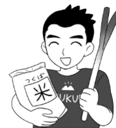
つくば市長 五十嵐立青