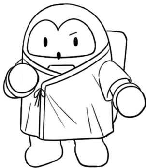
つくば市イメージキャラクター フックン船長