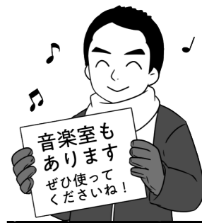
つくば市長 五十嵐立青