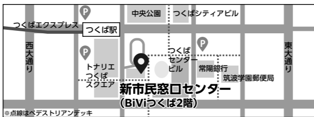
つくば駅前市民窓口センター

業務 他の市民窓口センター業務と同内容 (転入届などの住所変更届の受け付け、住民票の写しなどの各種証明書の交付など)