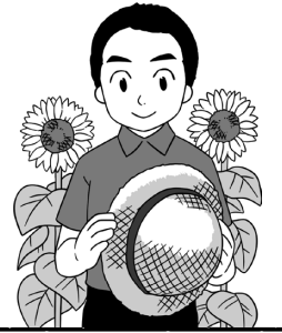
つくば市長 五十嵐立青