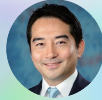
五十嵐立青 (つくば市長)