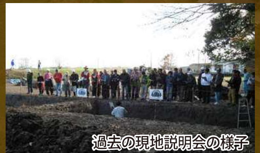
過去の現地説明会の様子