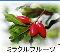
ミラクルフルーツ