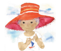
赤い帽子の女の子 1971年 ちひろ美術館