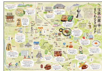
宝篋山麓まちあるきMAP