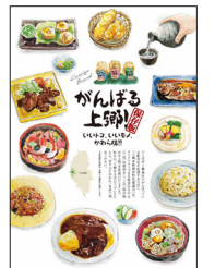
がんばる上郷！かわら版