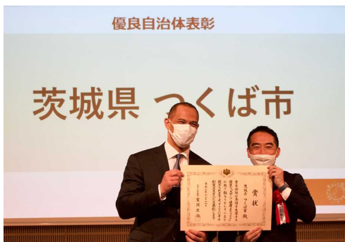
表彰式では室伏広治長官から表彰状が授与されました (写真提供可)