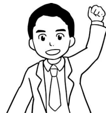
つくば市長 五十嵐立青