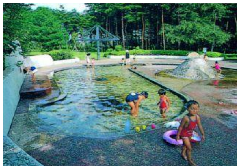
松代公園くまさん池