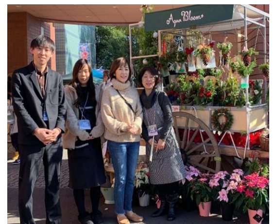
(3) クリスマスタウンで花屋とコラボ

『旅する大八車と小さなパレード』とは、かつて荷物運搬道として栄えた「つくば道」などで用いられた大八車を再活用し、つくば市周辺の旧市街地を移動しながら、地域で開催される祭や市場、廃校となった小学校でのイベントなどに参加することで、地域の隠れた魅力を発見し、周辺市街地に新たな繋がりをつくるプロジェクトです。