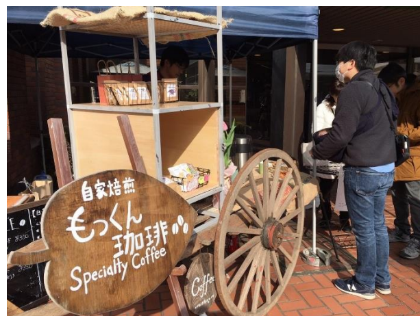
(2) 大曾根・筑穂・花畑タウンマルシェで「もっくん珈琲」とコラボ