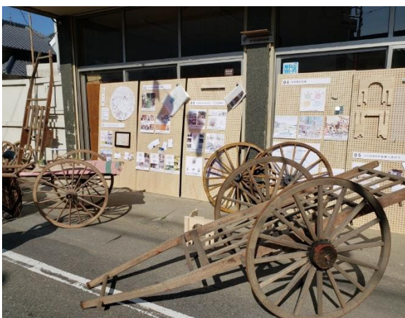
(1) 北条地区の「北条市」への出展