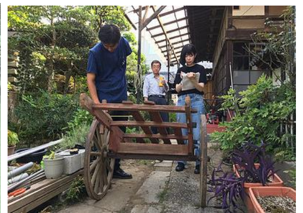
谷田部地区の大八車

『旅する大八車と小さなパレード』とは、かつて荷物運搬道として栄えた「つくば道」などで用いられた大八車を再活用し、つくば市周辺の旧市街地を移動しながら、地域で開催される祭や市場、廃校となった小学校でのイベントなどに参加することで、地域の隠れた魅力を発見し、周辺市街地に新たな繋がりをつくるプロジェクトです。