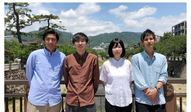
提案したつくば市出身者2名を含む 建築設計ユニット「studio weekend」

今回、「秋の北条市」と「谷田部市街地のオータムフェア」という2つのイベントに参加します。