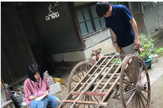
北条地区の大八車

つくば市が実施した「つくばR8地域活性化プランコンペティション」に採択されたプラン『大八車と小さなパレード』のプレイベントとして「大八展」が、北条地区で11月2日（土）、谷田部地区で3日（日）にそれぞれ開催されます。