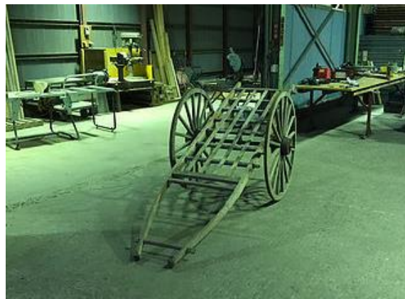
小田地区の大八車