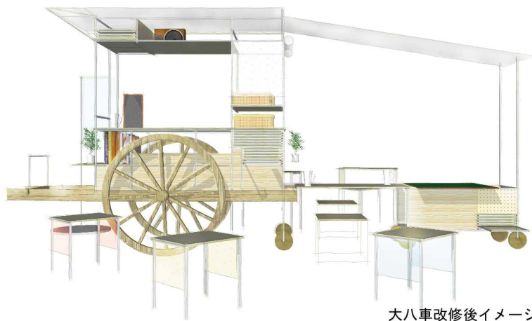
大八車改修後イメージ