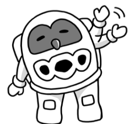
つくば市イメージキャラクター フックン船長