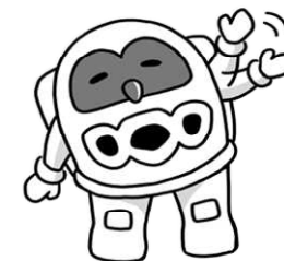
つくば市イメージキャラクター フックン 船長